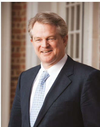
Гордон Робертсон Президент та генеральний директор CBN