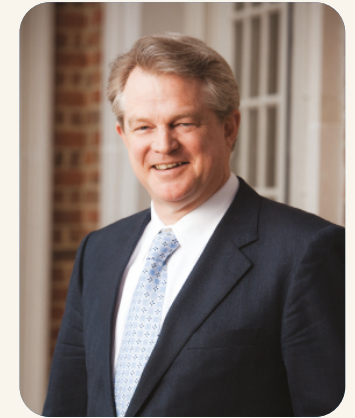
Гордон Робертсон Президент і головний виконавчий директор CBN

Ось чому я так глибоко вдячний за надійну інформаційну опору, яку забезпечили CBN News у ці буремні часи. Кожен член новинної команди виходить за межі своїх обов'язків, щоб транслювати змістовні репортажі про знаменні події, що формують наше майбутнє.