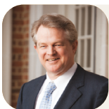
Гордон Робертсон Президент і головний виконавчий директор CBN

«Я прийшов, щоб люди мали життя й щоб мали його в достатку» (Івана 10:10)