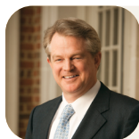
Гордон Робертсон Президент і головний виконавчий директор CBN

Нехай цей день – сьогодні – стане днем, коли ти справді зрозумієш, що рай може прийти до тебе.