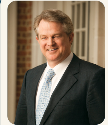
Гордон Робертсон Президент і головний виконавчий директор CBN

Я впевнений, що Бог хоче говорити з нами, і хоче, щоб ми Його слухали. Біблія говорить, що ще до того, як закласти основи світу, Бог запланував добрі справи, до яких ми маємо йти (див. Ефесян 2:10), і життя кожної людини має мету. Я вірю, що Він відкриває це кожному з нас Духом Святим. Римлянам 8:14 сказано: «Бо всі, кого водить Дух Божий, — вони сини Божі». Тому я щодня запитую Господа: «Що Ти хочеш, щоб я зробив сьогодні? Що Тобі до вподоби?»